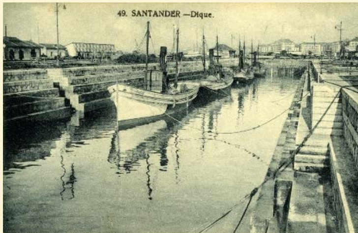
R. 8105 D. 1628 Edición La Ideal. Santander. Dique. 1930